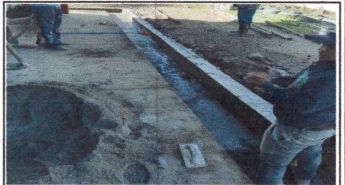
Foto 4: Fundiendo nuevamente las cunetas con material concreto en las cunetas a reparar. Cantidad 36 metros.