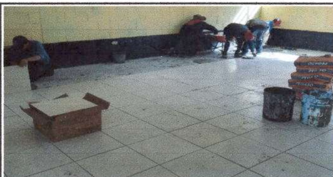
Foto 5: Instalando piso en dos modulos y la dirección del establecimiento educativo, equivalente a 165 metros cuadrados.