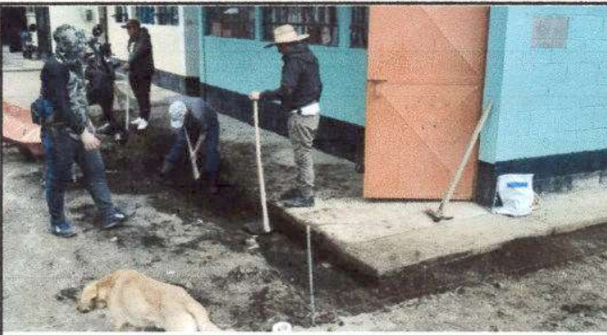
Foto 3: Removiendo el material concreto de las cunetas que ya no sirven. Cantidad 36 metros.