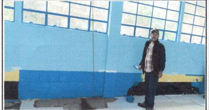
Foto 2: Pintando las paredes interiores e interiores del centro educativo. Equivalente a 318 mts.