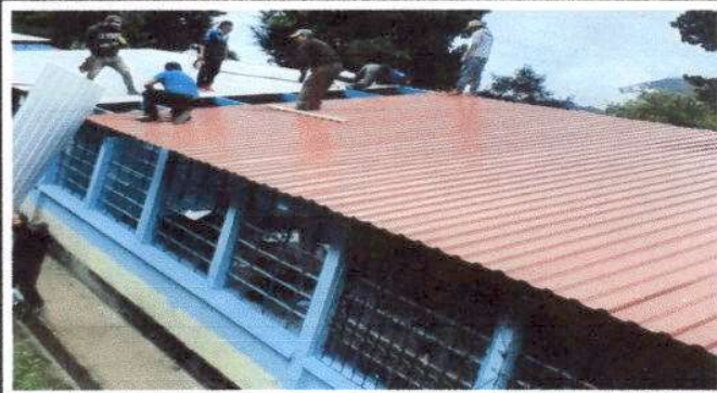
Foto1: Desinstalando e instalando lamina troquelada aluzinc calibre 26. Medidas: 21mts. Largo por 11.5 de hancho equivalente a 42 laminas en total.