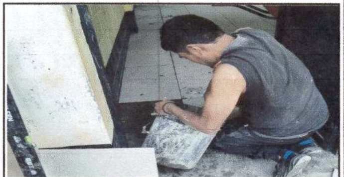
Foto 5: Contiuación de la Instalación de piso en dos modulos y la dirección del establecimiento educativo, equivalente a 165 metros cuadrados.

Observación: Si es necesario se pueden agregar hojas adicionales y actualizar el número de hojas.